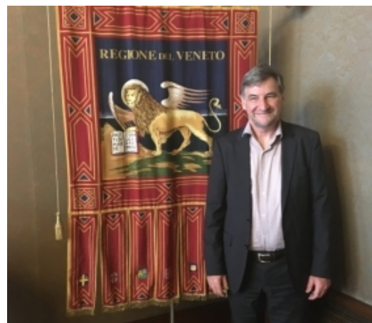
Werkbezoek Biennale Venetië